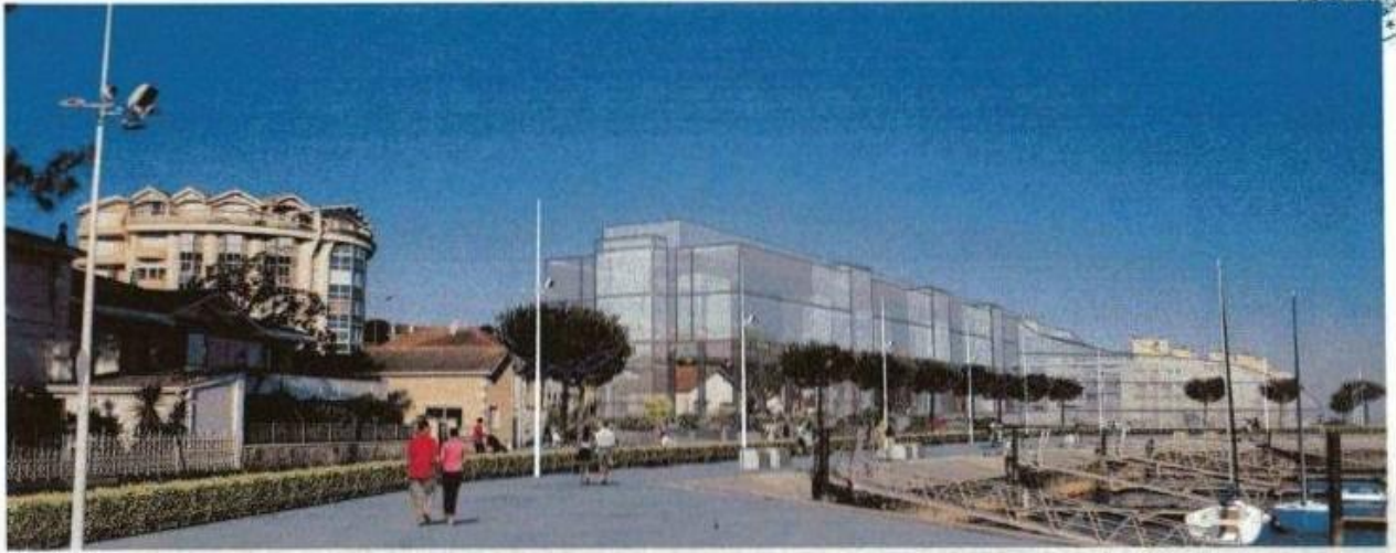
Insertion du volume du projet depuis le Port de Plaisance