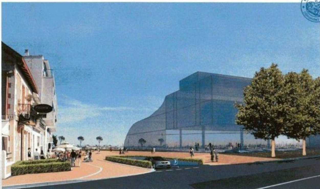
Insertion du volume du projet depuis la rue des marins