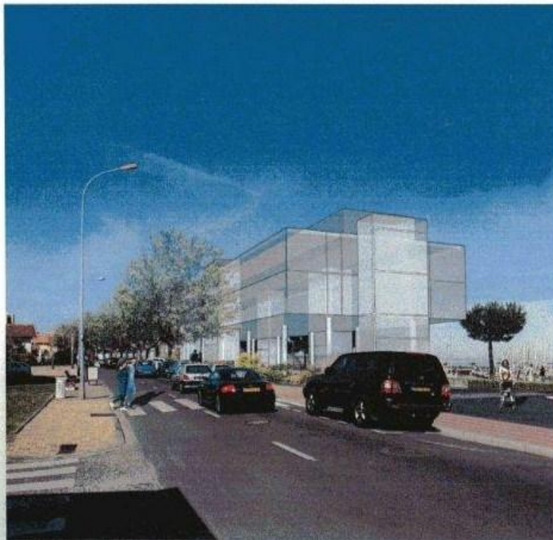
Insertion du volume du projet depuis le boulevard de la Plage