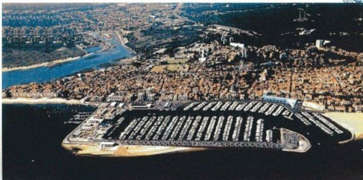
Insertion aérienne du volume du projet